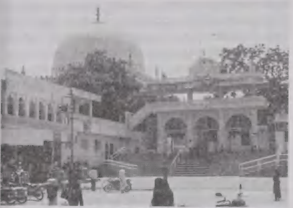
ಬಂದೇ ನವಾರ್ಯ ದರ್ಗಾ, ಗುಲ್ಬರ್ಗಾ

ಅದೇ! ಹಾಸಿಗೆಯೂ ಅದೇ! ಊರಿಂದೂರಿಗೆ ಅಲೆಯುವಾಗ ಅದರಲ್ಲೇ ತಮ್ಮ ತೀರ ಅಗತ್ಯದ ಸಾಮಾನುಗಳನ್ನು ಒಯ್ಯುತ್ತಿದ್ದರು. ವೈರಾಗ್ಯದ ಸಂಕೇತವಾದ ಸೂಫಿ (ಕಂಬಳಿ)ಯಿಂದಾಗಿ 'ಸೂಫಿ'ಗಳೆಂದು ಗುರುತಿಸಲ್ಪಡುತ್ತಿದ್ದರು. ಸೂಫಿಗಳಲ್ಲಿ ವಿದ್ವಾಂಸರು, ಸಂಸಾರಿಗಳು, ವಿರಕ್ತರು, ಕವಿಗಳು, ಸಂಗೀತಕಾರರು ಕಾಣಿಸಿಕೊಂಡರು.